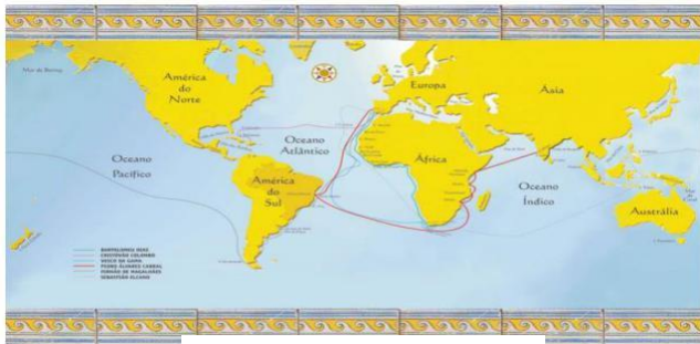
Mapa das Grandes Navegações

2. Escreva os tipos de rotas praticadas de cada desenho.